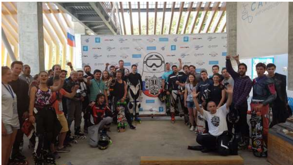
Die Teilnehmer des Beton-on-fire Events in Russland