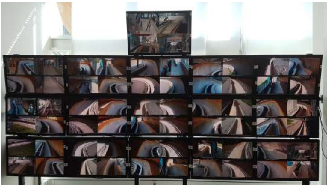
Sicherheit auf der Bahn das A&O des Downhillrennsports auf der Bobbahn.