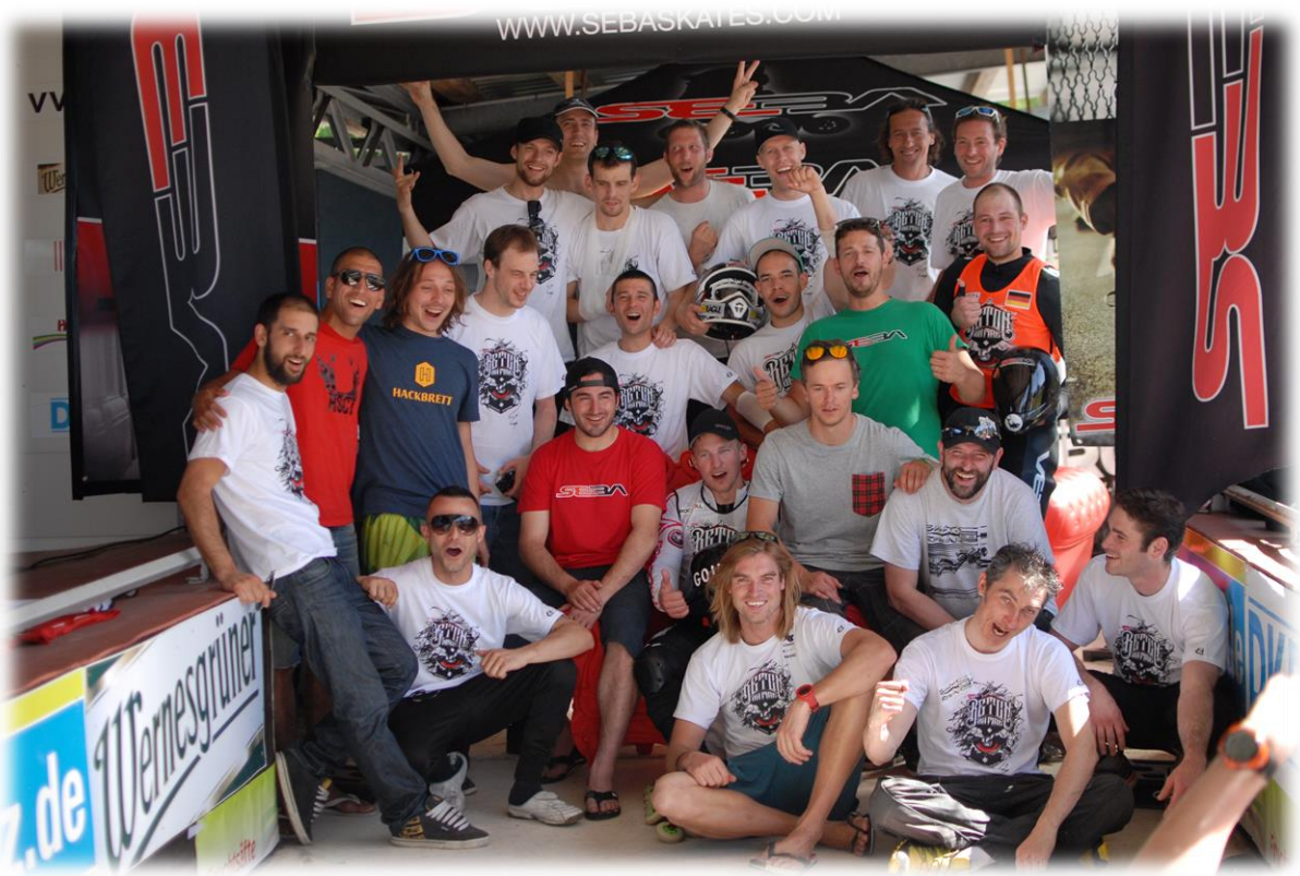
Eine eingeschworene Gemeinde: Downhiller aus ganz Europa feierten den Abschluss von Beton-on-fire in Altenberg