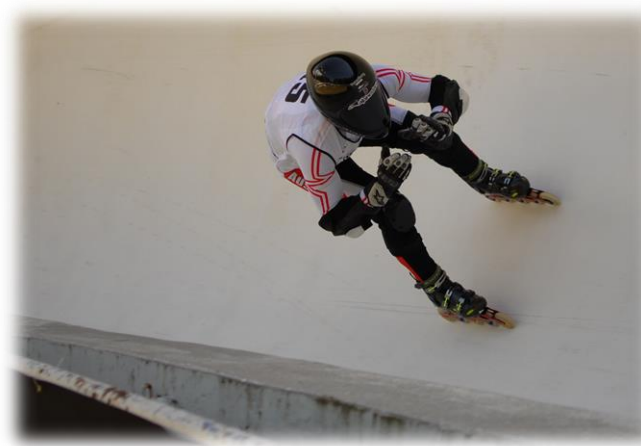
Der Kreisel der Rennschlitten- und Bobbahn in Altenberg

Ein Wochenende der Extremsportler im Kreis der Inlinefreunde: Hervorragende äußere Bedingungen und ein 30-köpfiges Starterfeld der weltbesten Downhiller aus der Schweiz, Österreich, Frankreich, Italien, Russland, Niederlande, Liechtenstein und Deutschland garantierten spektakuläre Rennen auf der Rennschlitten- und Bobbahn im sächsischen Altenberg.